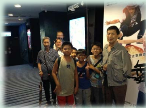
齊到戲院欣賞多啦A夢大電影