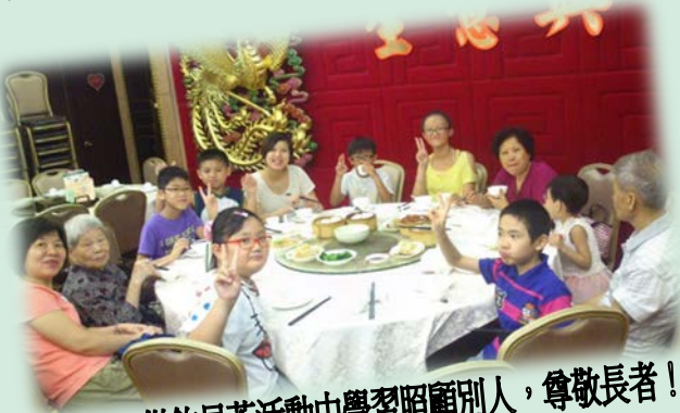
小義工從飲早茶活動中學習照顧別人，尊敬長者！

部份離院長者，欠缺社交支援網絡，以及病患帶來的不便，限制他們接觸社區的機會。是次活動旨在提供機會讓青少年服務長者，從活動中了解長者的生活習慣及學習長者堅毅不屈的精神；而長者亦能透過活動認識時下年青人的喜好及將多年的人生經歷傳承，長幼之間互相學習認識，打破隔膜，達致跨代共融！