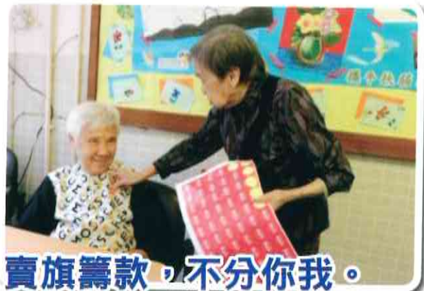
賣旗籌款，不分你我。