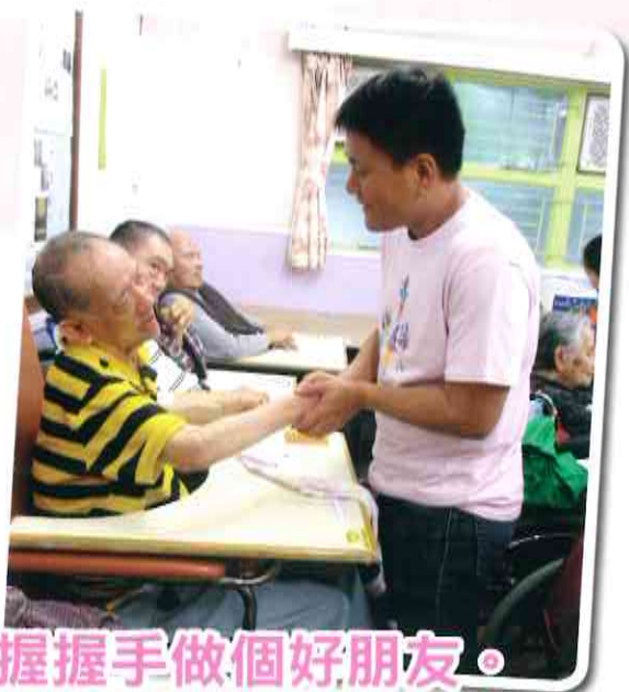
握握手做個好朋友。