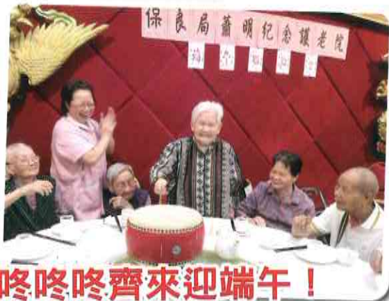
咚咚咚齊來迎端午！