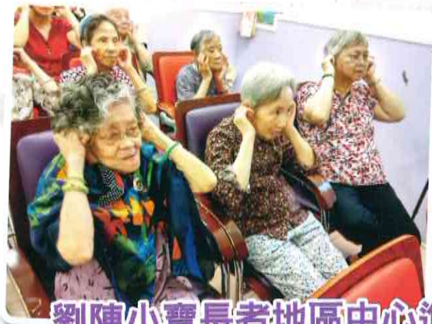
劉陳小寶長者地區中心進行探訪，勤做運動身體好。