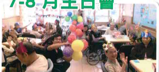
生日會有得玩，人人有禮物