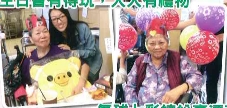
氣球七彩繽紛真漂亮!