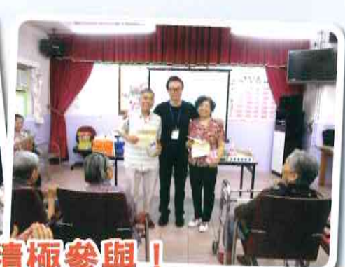
樂在書連 Ipad 義工嘉許禮，院友積極參與！