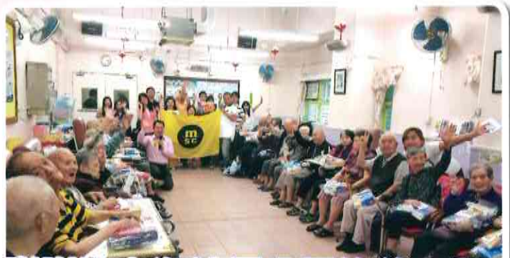
謝謝地中海航運公司的義工們!