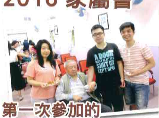
第一次參加的 練漢強家庭。