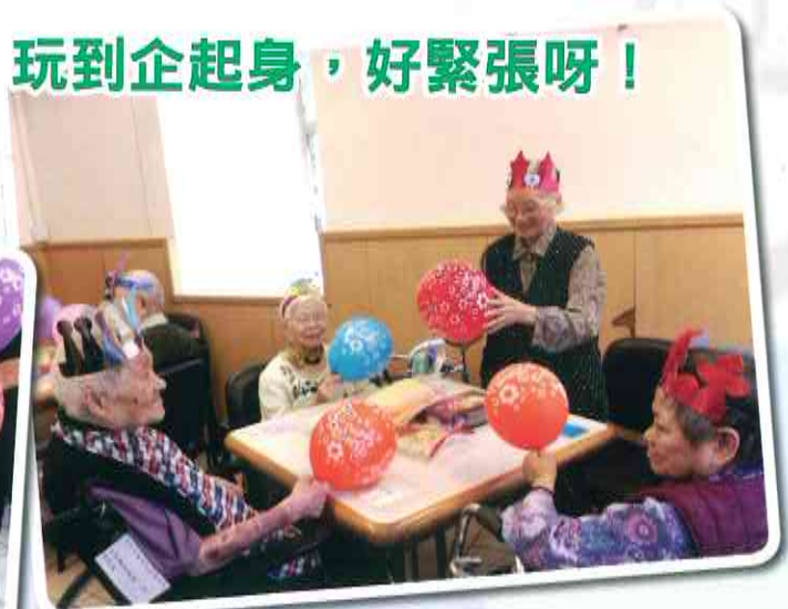
玩到企起身，好緊張呀!