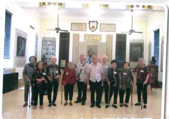
參觀保良局博物館，關帝廳真有氣派，令人肅然起敬！