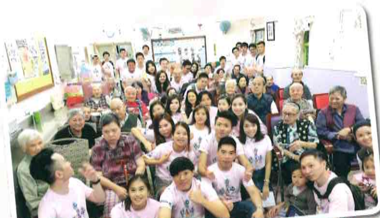
康宏義工朋友與我們歡聚一堂。