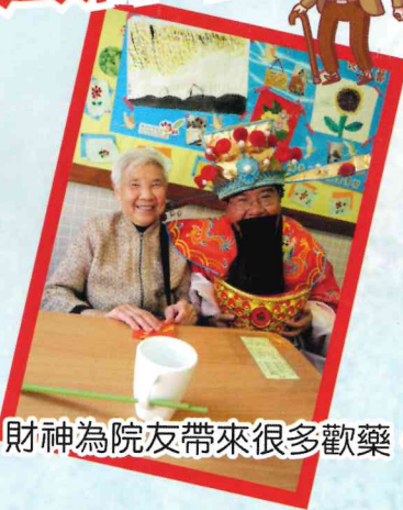
財神為院友帶來很多歡樂。