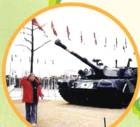
在韓國與坦克車合照!