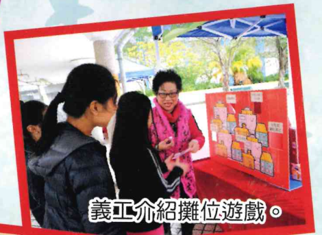
義工介紹攤位遊戲。