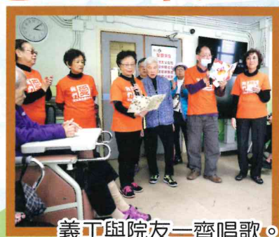
義工與院友一齊唱歌。