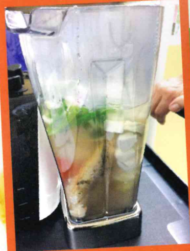
製成品 蕃茄洋葱豆腐魚湯

院舍長者進食糊餐人數增加，本局持續發掘不同的科技產品，務求優化糊餐的色、香、味、型。廚師試用「自然養生機」，發現糊餐幼滑度提升、保留菜色的味道及營養。長者及家屬試食，十分欣賞。故本局未來逐步引入自然養生機，優化有營餐膳。