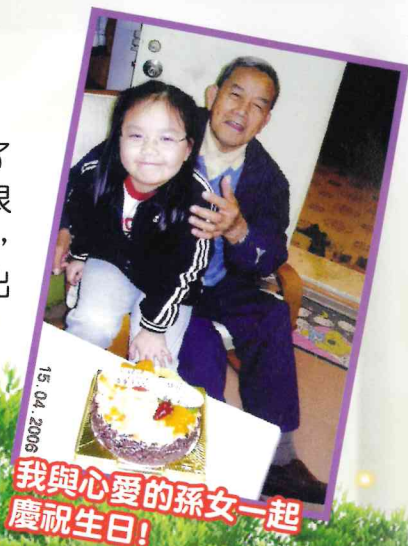
我與心愛的孫女一起慶祝生日!

行了八年船後，我遇上了我的妻子。我們經朋友介紹而結識，交往了二年就結婚，婚後育有兩子兩女。由於要在香港照顧家庭，即使我很享受行船這份工作，我還是決定辭職，留在香港陪伴妻兒。在我眼中，沒有甚麼比家庭重要了。回到香港，我和妻子一起照顧家庭，我外出打工賺錢，她在家帶小孩做家務。在這段期間，我打過不同種類的工，包括碼頭工人、地盤工人、保安等等。雖然工作辛苦，但一想起能讓妻兒有安穩的生活，再辛苦也是值得的。