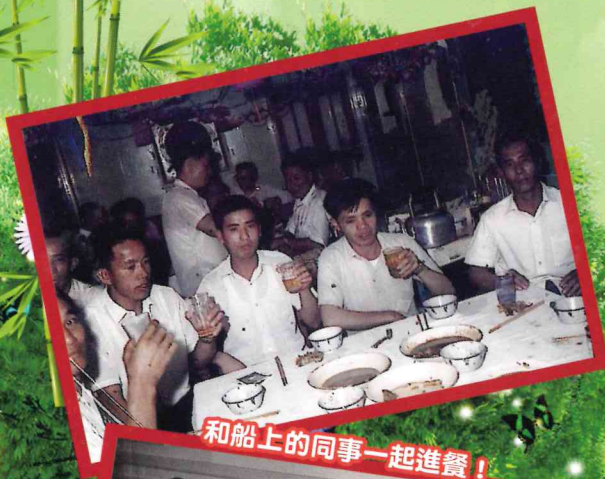
和船上的同事一起進餐！