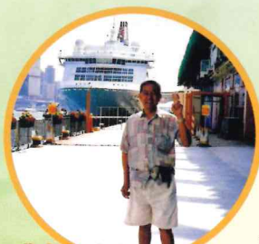
我有很多與船隻的合照。這是其中一張。

談起與家人的相處時間，莫過於好好吃一頓。每天清早上班前，我都會和家人到茶樓吃早餐。對我來說，能與家人共聚、看見妻兒健康快樂地成長，便是我工作最大的動力了！除了賺錢養家，我還會為妻子分擔家務，負責為家人烹煮每晚的晚餐。在假日不用上班的日子，我更會烹煮比較貴的食材，例如紅衫魚，讓妻兒能夠大飽回福。