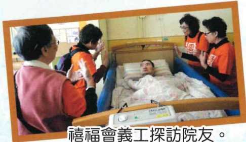
禧福會義工探訪院友。