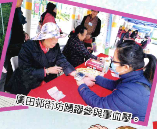
廣田邨街坊踴躍參與量血壓。