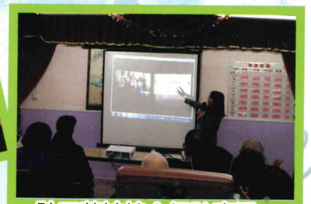
社工葉姑娘介紹社康活動。