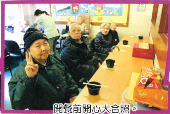
開餐前開心大合照。