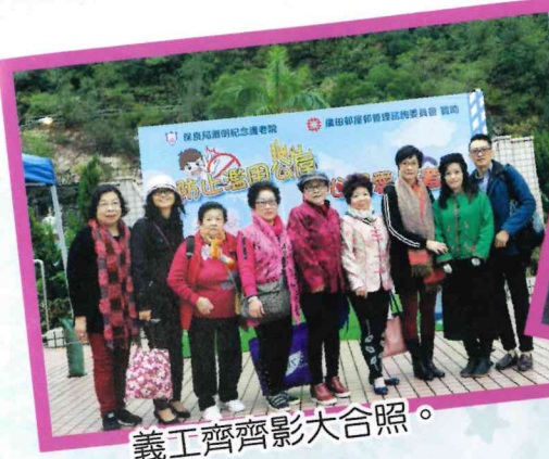
義工齊齊影大合照。