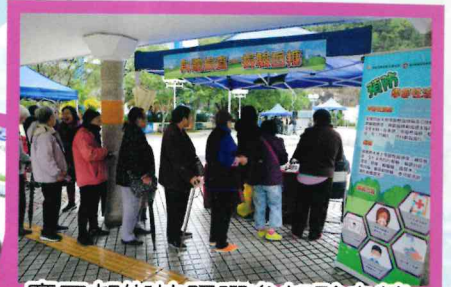
廣田邨街坊踴躍參加驗血糖。