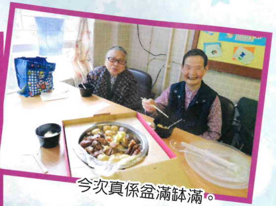
今次真係盆滿鉢滿。