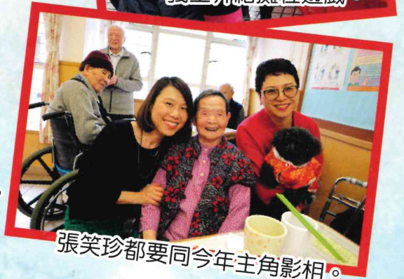
張笑珍都要同今年主角影相。