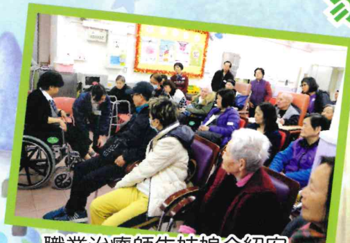
職業治療師朱姑娘介紹安全使用輪椅技巧。