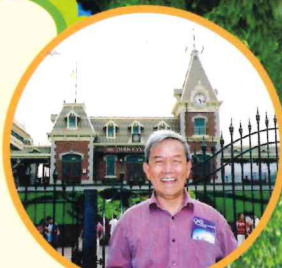
我是主題樂園的常客。

退休後，我喜歡四處遊玩。家人常伴我到訪中環、尖沙咀等沿海地帶，我們會一起飲茶、坐摩天輪、到海傍散步。一看見大型船隻泊岸，我就會和它合照。此外，我又會參觀有關船的博物館，去欣賞船隻的模型及了解船的歷史。畢竟我以往是從事這一行業，日子久了，也會對船產生一份特別的感情。除此以外，我還會到外地旅遊。早在退休初時，家人便伴我到韓國旅遊，放鬆心情。我喜歡及時行樂，趁還是「行得走得」，當然要多看看世界不同風光！