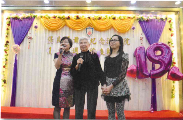
桂姐與院友、同工為院慶表演粵曲