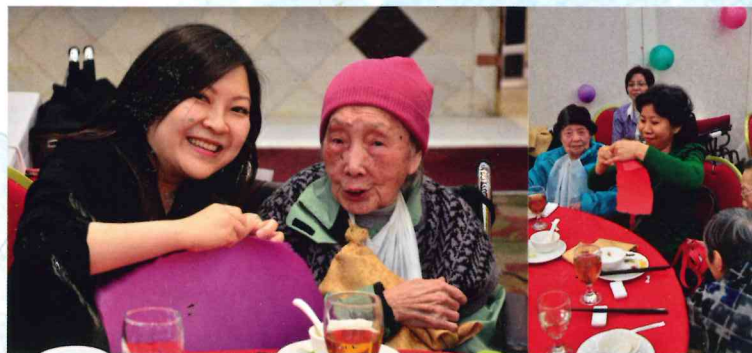
▲ 「長壽麵」遊戲，家屬及院友都十分投入遊戲，大家打氣加油，越長越好！