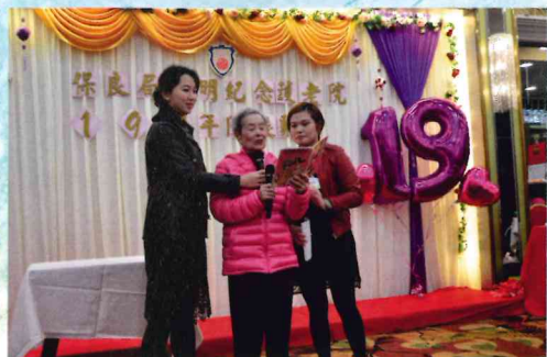
▲ 頤智園服務使用者獻唱金曲