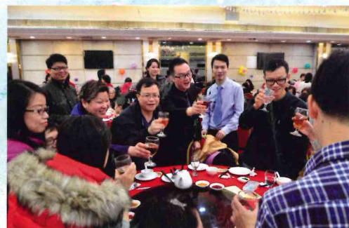
▲ 院舍19歲生日快樂，飲杯！