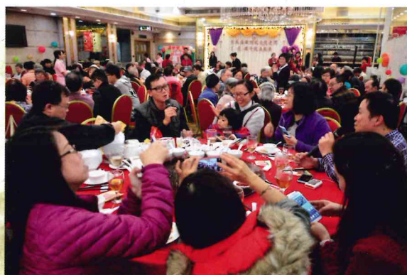
▲ 藉此機會向媽媽唱出「每天愛你多一些」