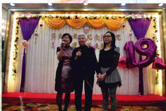
▲ 院舍醫護組及院友歌唱表演