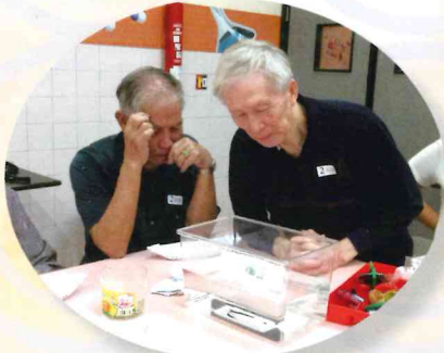
▲ 左想右想，科學遊戲要想想