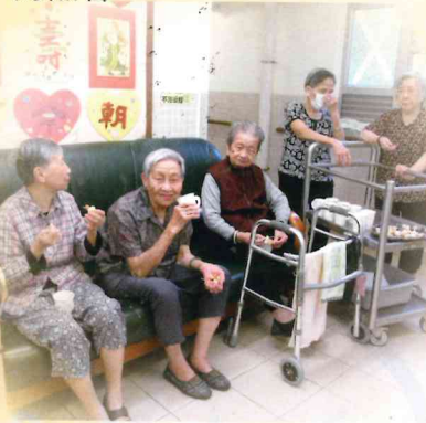
▲ 看罷懷舊電視劇，來個懷舊下午茶