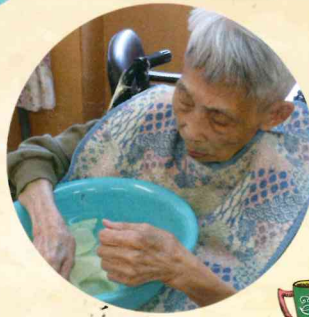
▲ 董歡顏好整潔的習慣依然保持