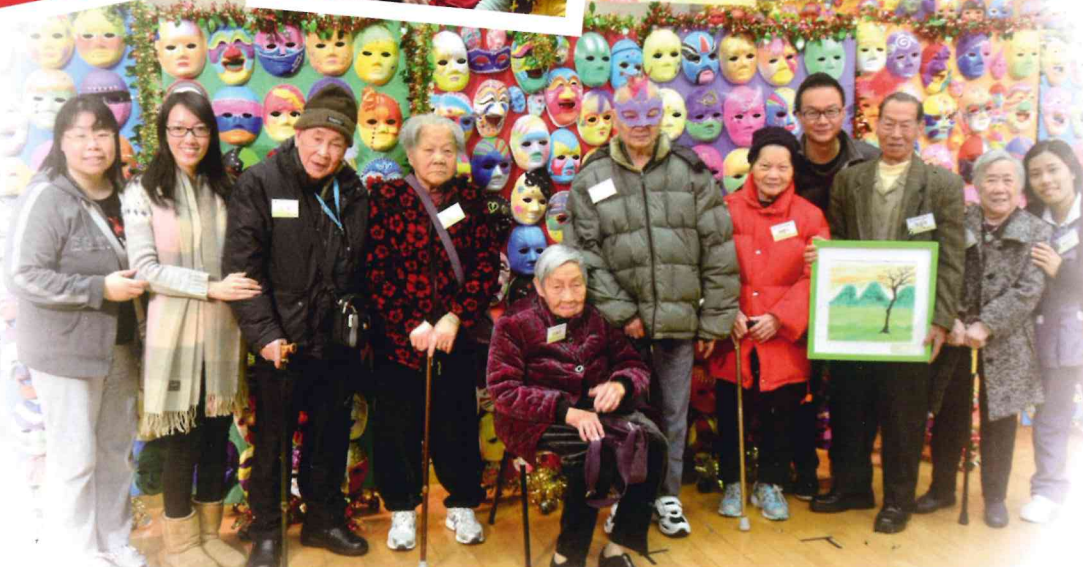
◀ 老友記急不及待帶上精美的面譜，令人眼前一亮！