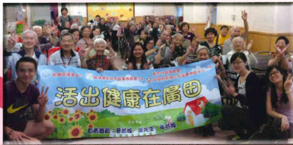
▲ 保良局劉陳小寶地區長者中心探訪