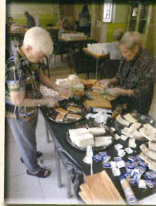
▲ 做牛油花生醬包功夫都唔少