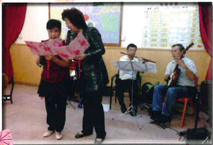
▲ 樂怡軒曲苑粵曲表演及探訪

本院定期與不同義工團體合作，為院友提供與社區人士交流之機會，保持院友與外界接觸，使長者身心、社交及康樂等各方面均得到擴展。