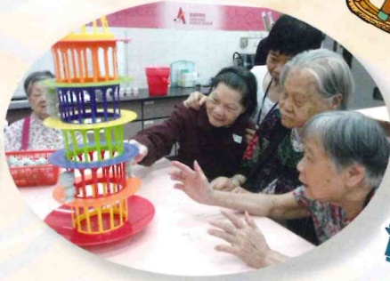
▲ 講力學考平衡，小心小心