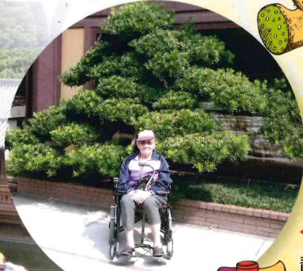
◀ 天朗氣清，靚人靚景 123 拍張大合照，快快笑一笑