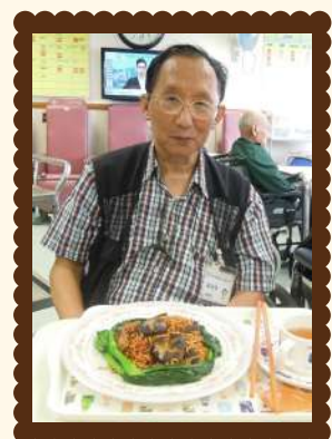
每年生日都由中心特意为長者準備生日餐