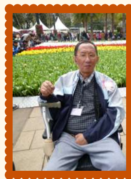
和「周老」會員一同參觀花展