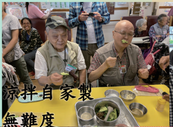
涼拌自家製 無難度