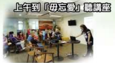
上午到「毋忘愛」聽講座