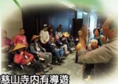
慈山寺內有導遊 帶我們一路遊覽