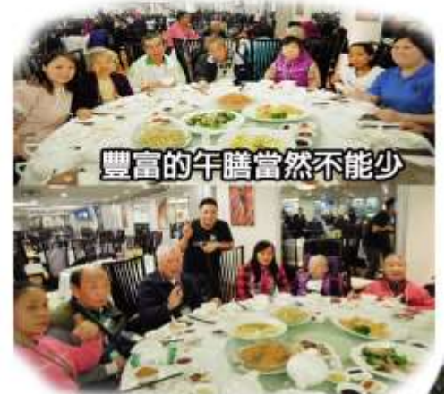
豐富的午膳當然不能少