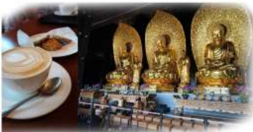
寺內提供免費茶點， 讓參觀者小休一下

我們上午到了社企「毋忘愛」了解香港環保殯儀服務， 而下午有幸到慈山寺，並近距離接觸欣賞這尊宏偉的觀音像； 站在觀音像前就感受到自己的渺小，一切煩惱都不再執著。