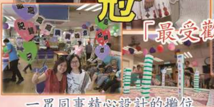
一眾同事精心設計的攤位 真係太好玩啦!!