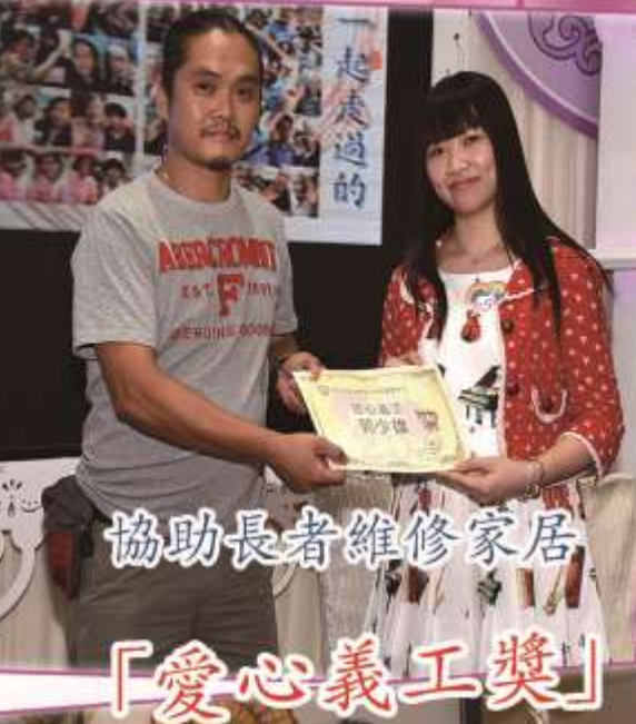
協助長者維修家居