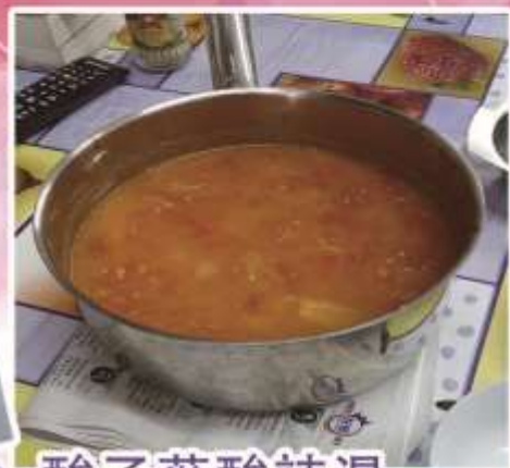
菜式：酸子葉酸辣湯