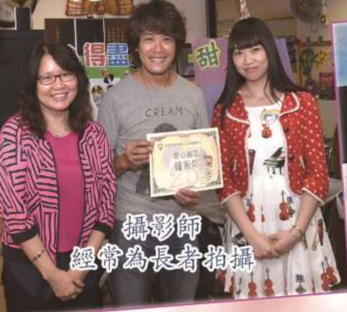
攝影師 經常為長者拍攝