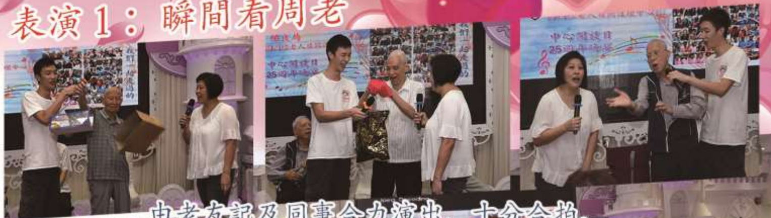
由老友記及同事合力演出，十分合拍。