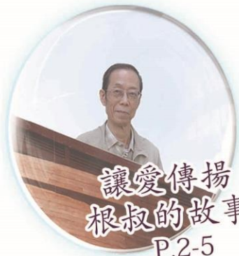
讓愛傳揚 根叔的故事 P.2-5