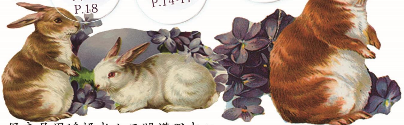
惜放晚晴 活動 P.19