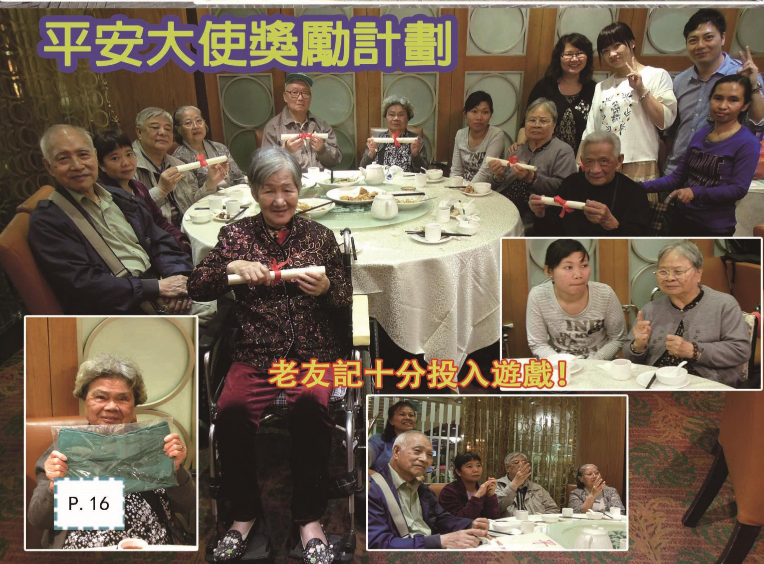
老友記十分投入遊戲!