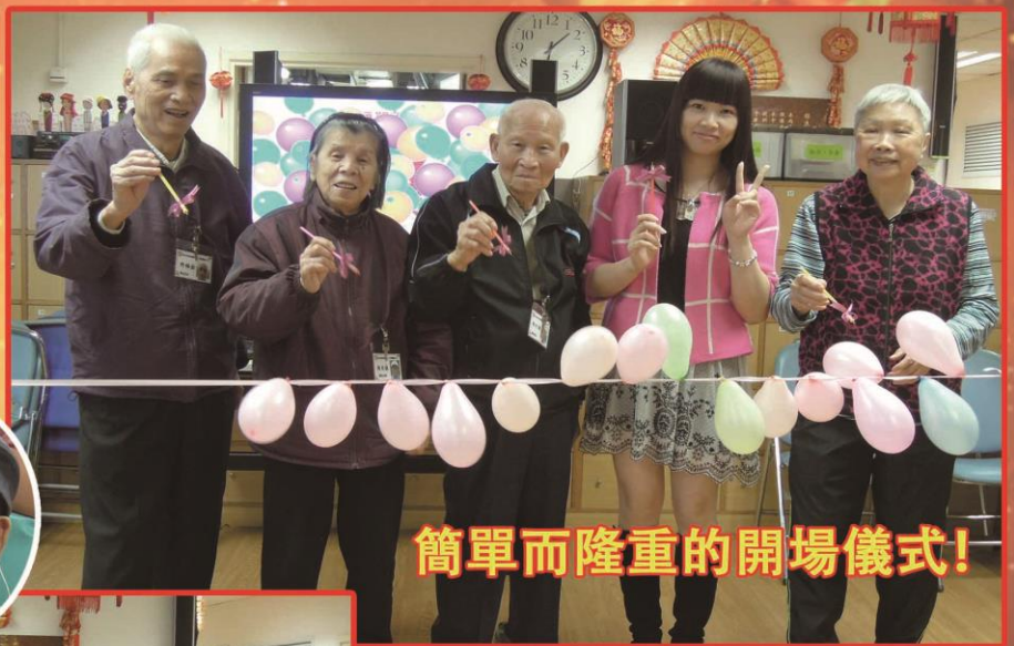
簡單而隆重的開場儀式!