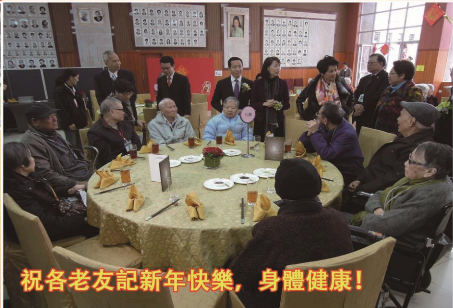
祝各老友記新年快樂，身體健康!