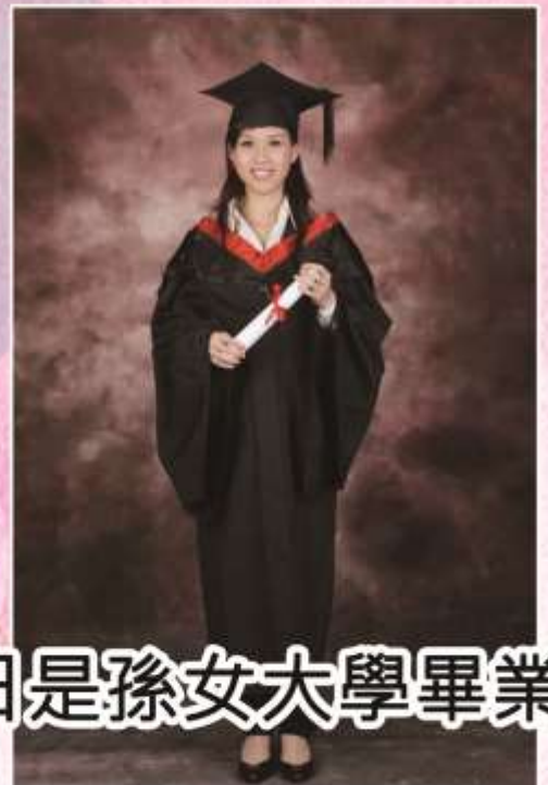
今天6月8日是孫女大學畢業