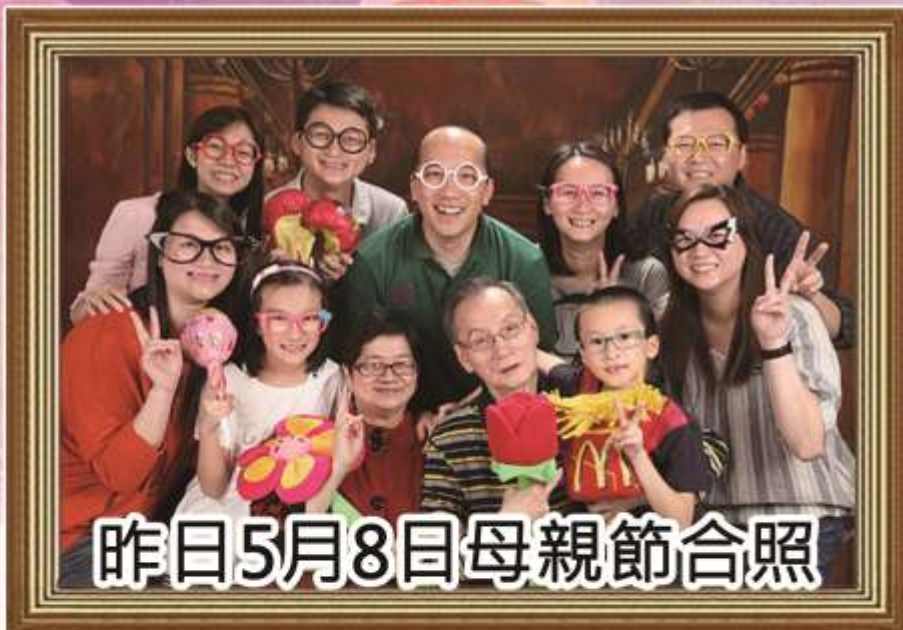
昨日5月8日母親節合照

舉個例子，母親節剛過，很多子女會與長者慶祝、拍照。子女可以為長者製造一個導向通訊板，或利用電子相簿和電視，定期發放資訊，讓長者可以記得當天的喜悅外，長者同時得到時間導向資訊，增加長者於家庭中的存在感，舒緩情緒。