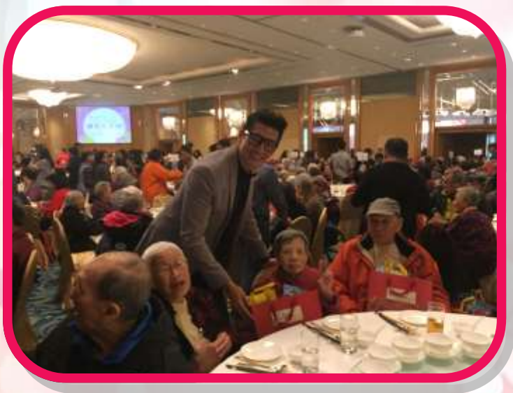
2018/01/24 關懷長者心新春茶聚