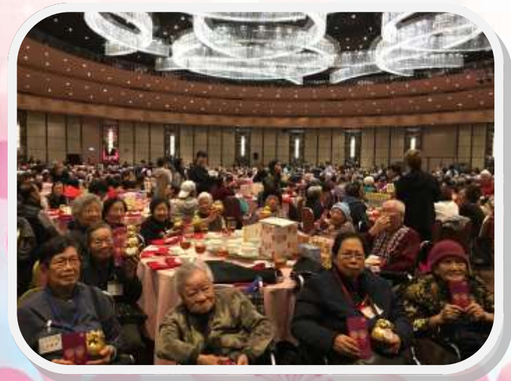
2018/02/27 保良局敬老賀新春