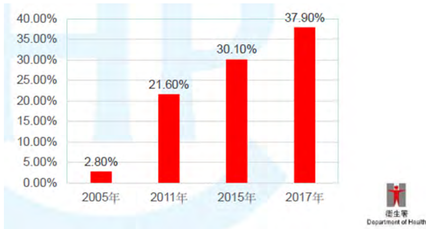
「耐藥性金黃葡萄球菌」在安老院舍的情況

耐藥性金黃葡萄球菌是本港安老院舍較常見的其中一種「多重耐藥性細菌」，且帶菌比率有持續上升趨勢。