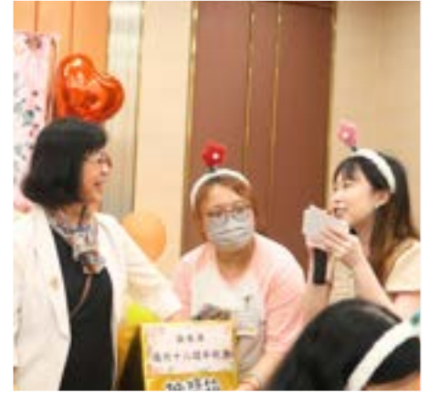
黃院長公佈抽獎幸運兒，參加者緊張又期待。