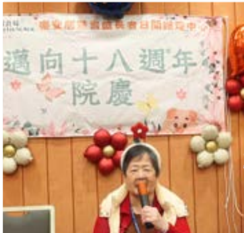
稱為樂安居歌后的老友記在聚餐獻唱「上海灘」，氣氛熱烈。

特別鳴謝署任吳高經、許經理、馮醫生和義工代表們抽空出席活動，為疫情後首次舉辦大型聚餐揭開序幕，一眾參加者都心花怒放，滿載而歸。