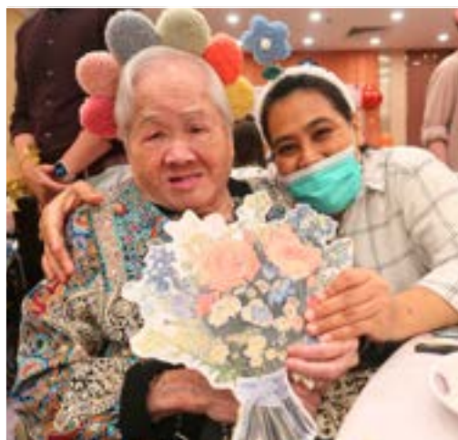
在場人士全部戴上五顏六色的花花頭箍，齊齊投入花花世界。