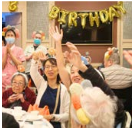
聽到自己中獎，長者和家人高興地舉手領取獎品。