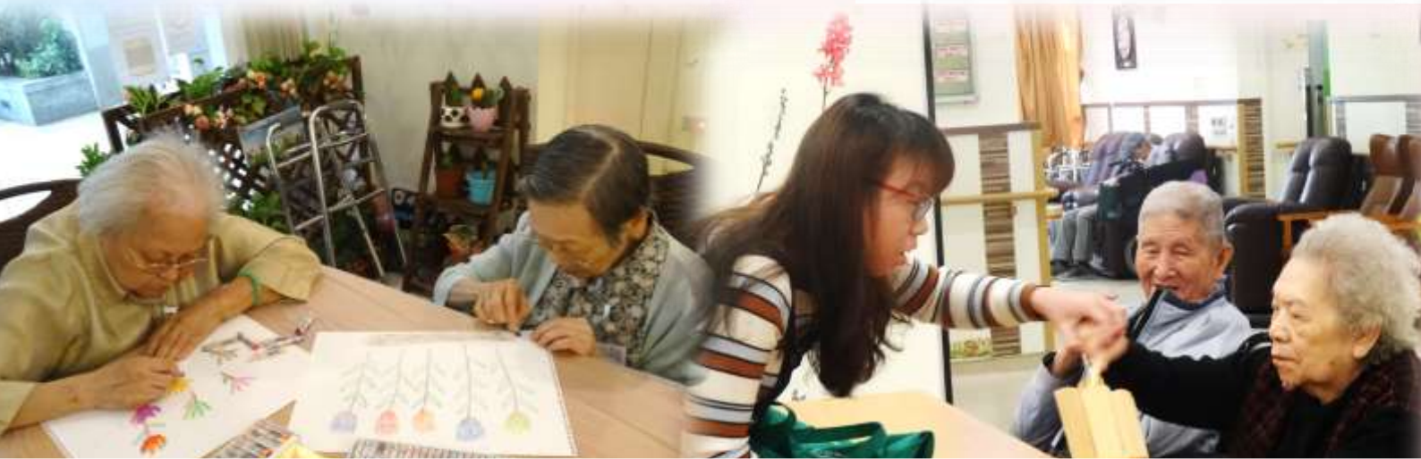
隨筆起舞畫畫小組