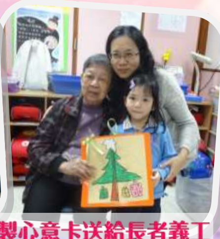
小朋友親手自製心意卡送給長者義工