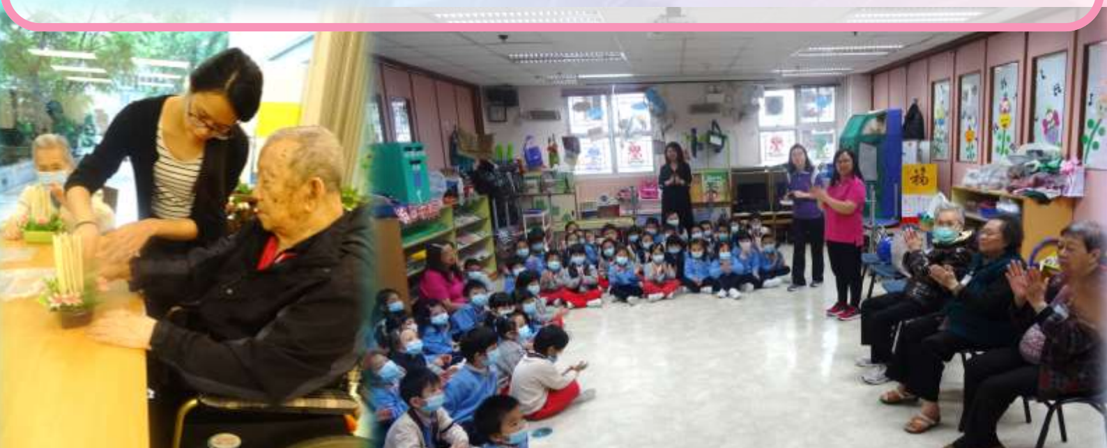
花之魅力插花小組 多才多藝大使義工探訪郭子樑幼稚園

計劃希望透過多元化藝術活動包括：手工組、音樂小組、插花小組及外出探訪等等，聯繫區內長者，增強長者之間的互相關顧，並增加與區內團體義工交流。達致關愛社區，同時讓長者持續學習及提升自信、發揮老有所為的精神。