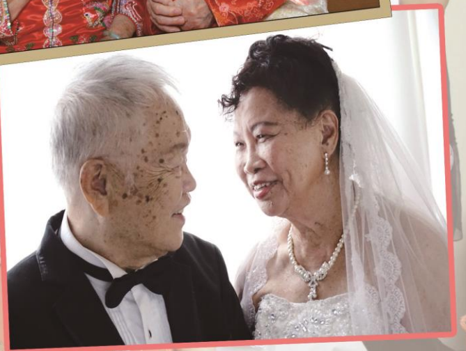
為五對老友記拍攝婚紗照