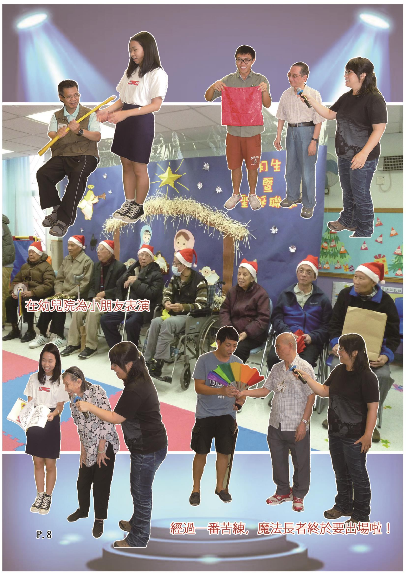
在幼兒院為小朋友表演