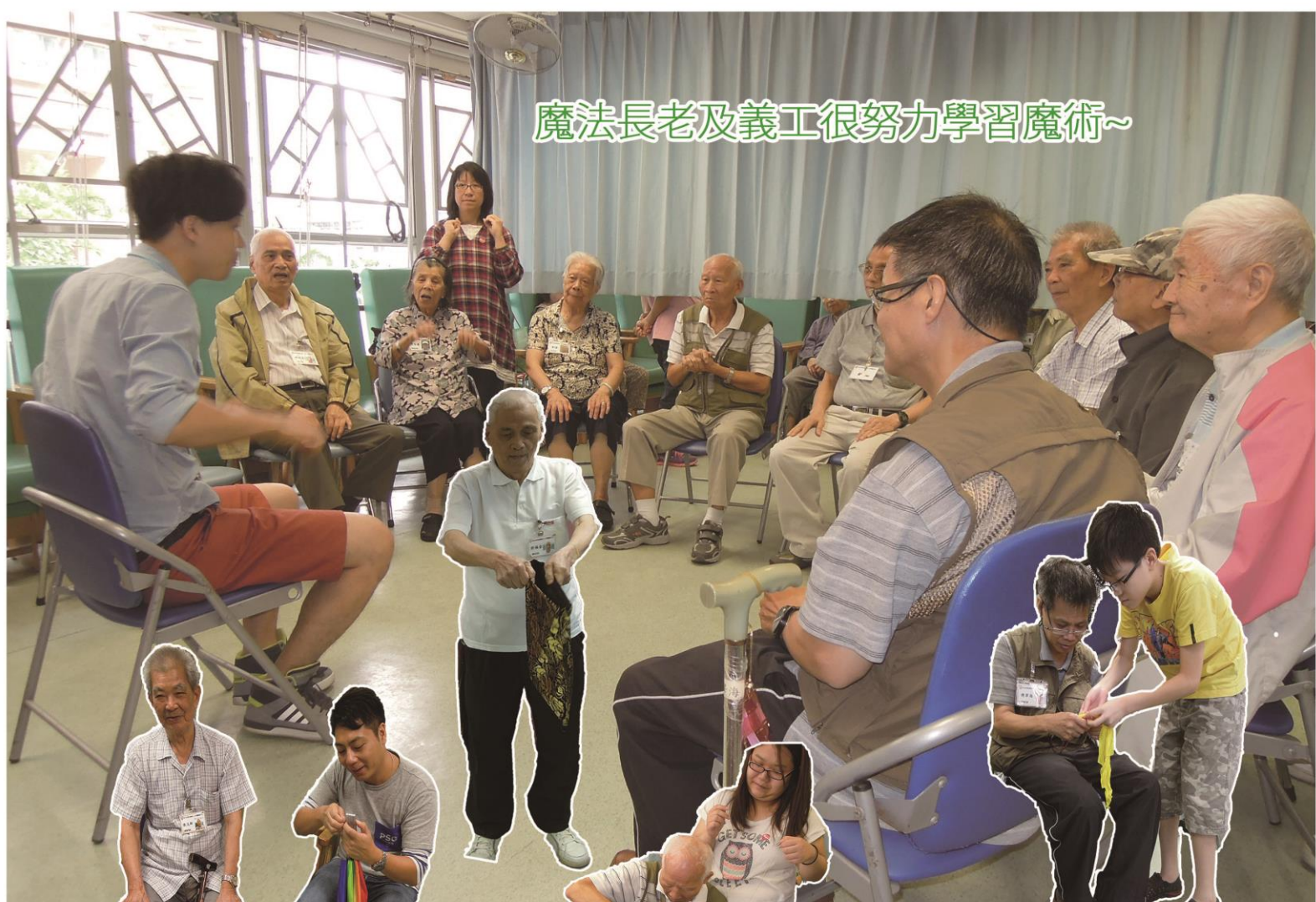
魔法長老及義工很努力學習魔術~