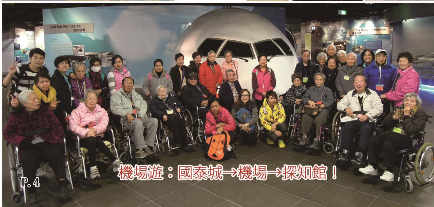
機場遊：國泰城→機場→探知館！