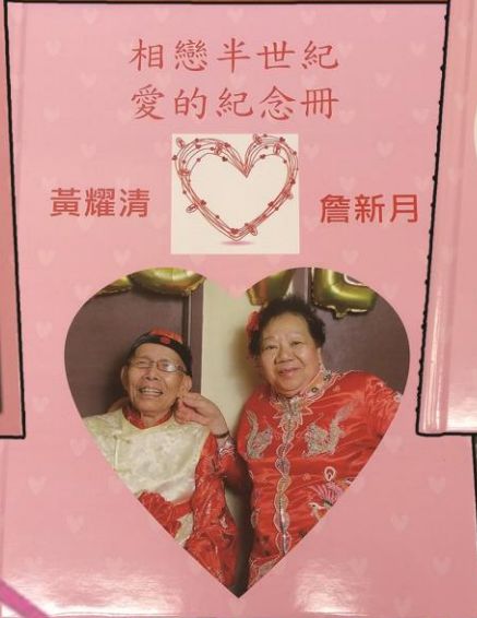
相戀半世紀 愛的紀念冊