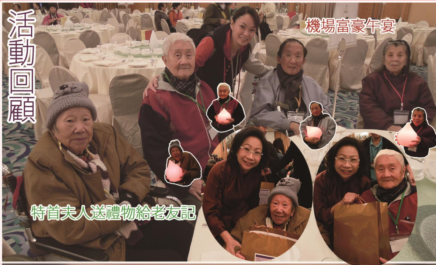
特首夫人送禮物給老友記