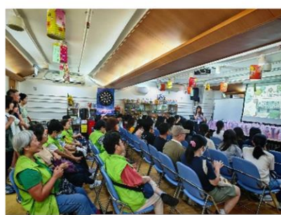
「秦石」「田」入屋中秋探訪及攤位活動