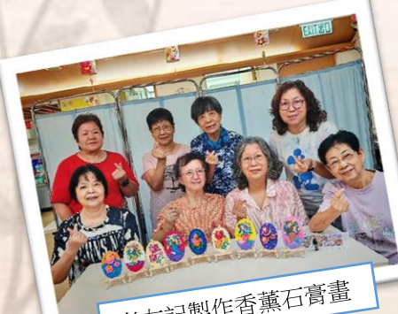
老友記製作香薰石膏畫