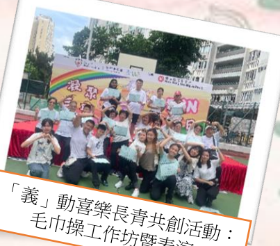
「義」動喜樂長青共創活動： 毛巾操工作坊暨表演