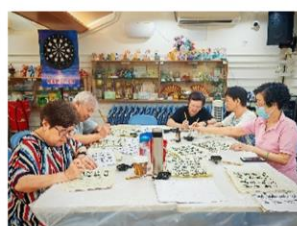
老友記練習書法， 延續《樂藝》書法活到老、 學到老的好學精神。