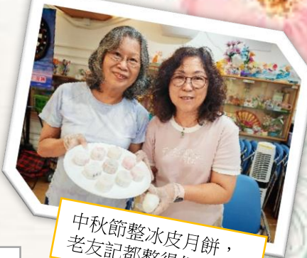
中秋節整冰皮月餅， 老友記都整得好投入