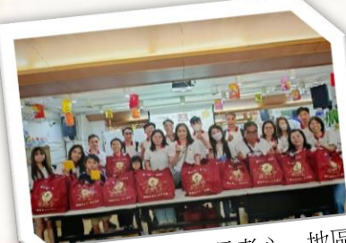
中銀 — 「關懷長者心」地區 中秋探訪活動