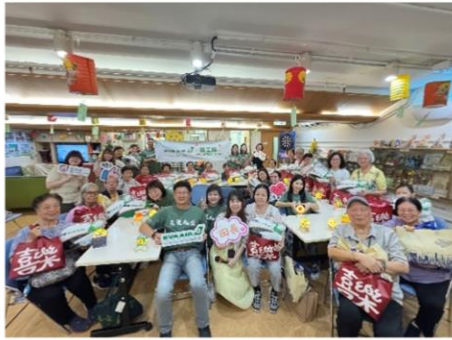
分享喜「月」- 長榮航空中秋探訪活動