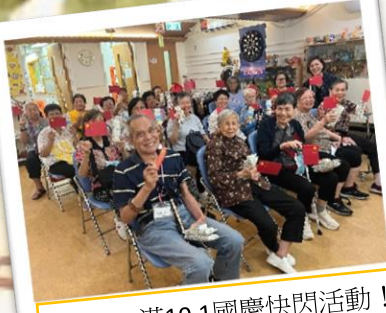
「田」滿10.1國慶快閃活動！