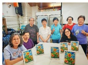
老友記製作鑽石畫， 為生活增添色彩