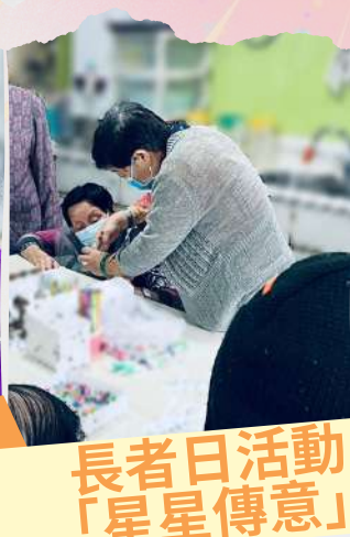
長者日活動 「星星傳意」