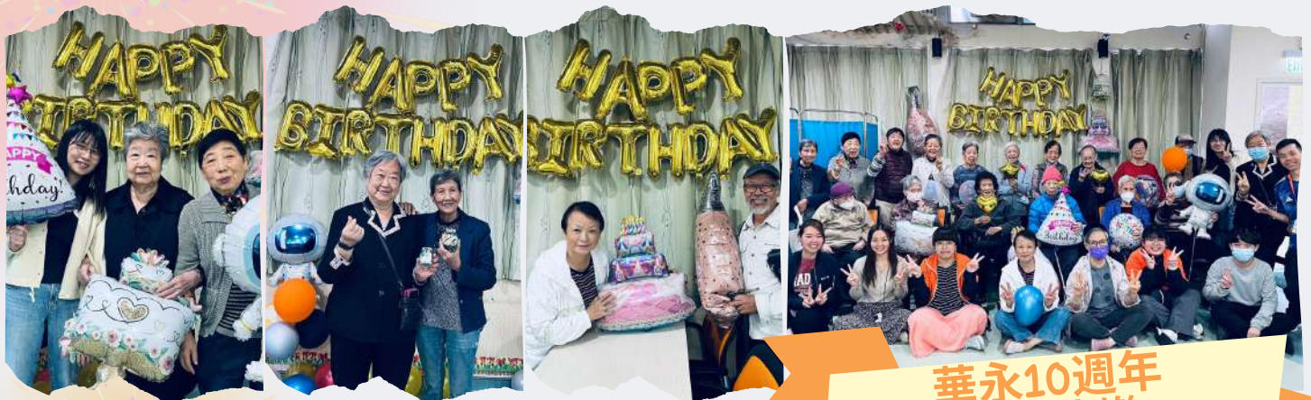
華永10週年 「生日快樂」