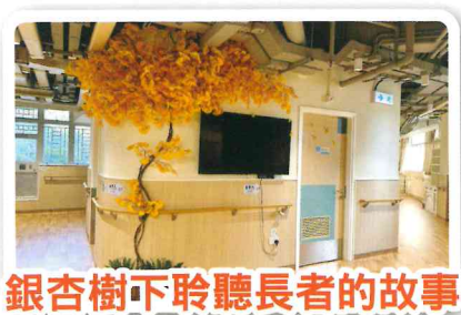
銀杏樹下聆聽長者的故事

藉蒙特梭利認知障礙症照護的三大方法：準備好的環境、具意義的活動及有工作角色的生活，令居住院舍的長者維持現有能力和增強獨立性，從而找到生活的樂趣及活出有意義的生活。