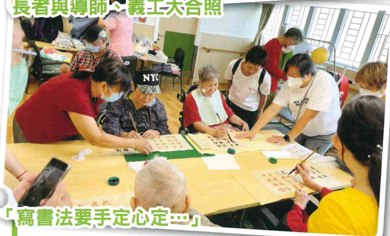
「寫書法要手定心定……」