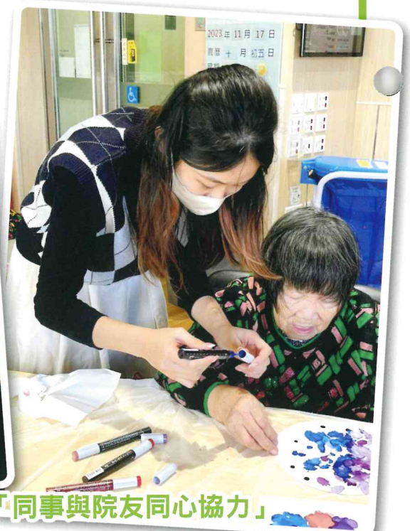
「同事與院友同心協力」