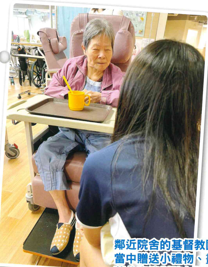
鄰近院舍的基督教國際學校多次探訪院友，當中贈送小禮物、畫畫、一起玩遊戲，藉此表達對院友的關心。