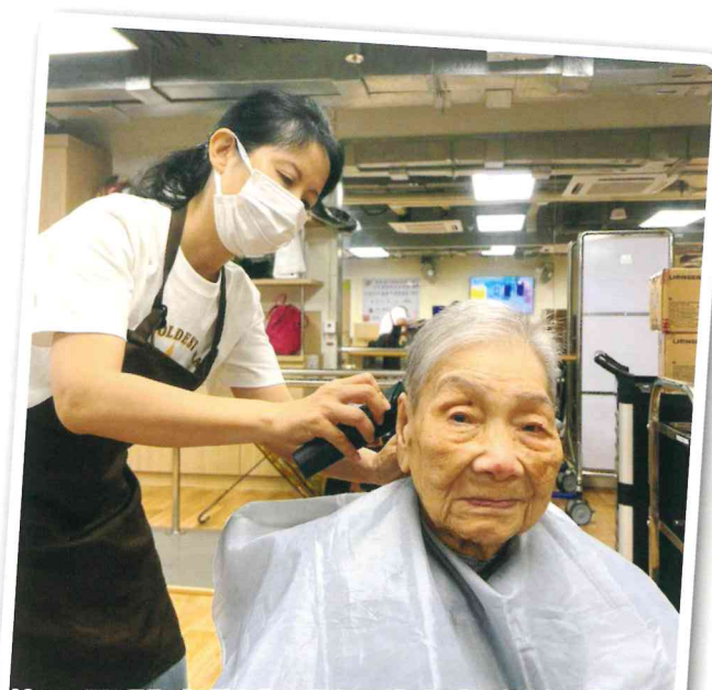
義工團體定期為我們院友提供免費的剪髮服務，剪髮期間都會與我們院友聊天。