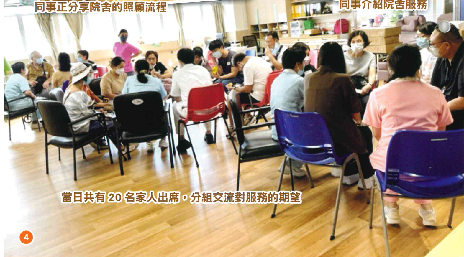
當日共有 20 名家人出席，分組交流對服務的期望