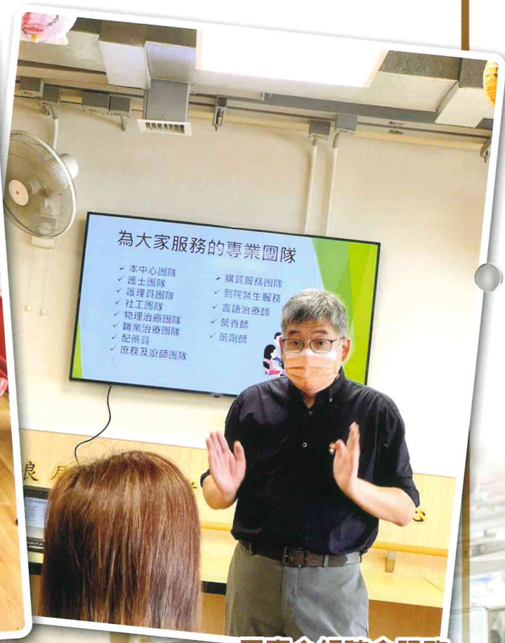
同事介紹院舍服務