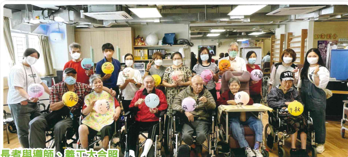
長者與導師、義工大合照