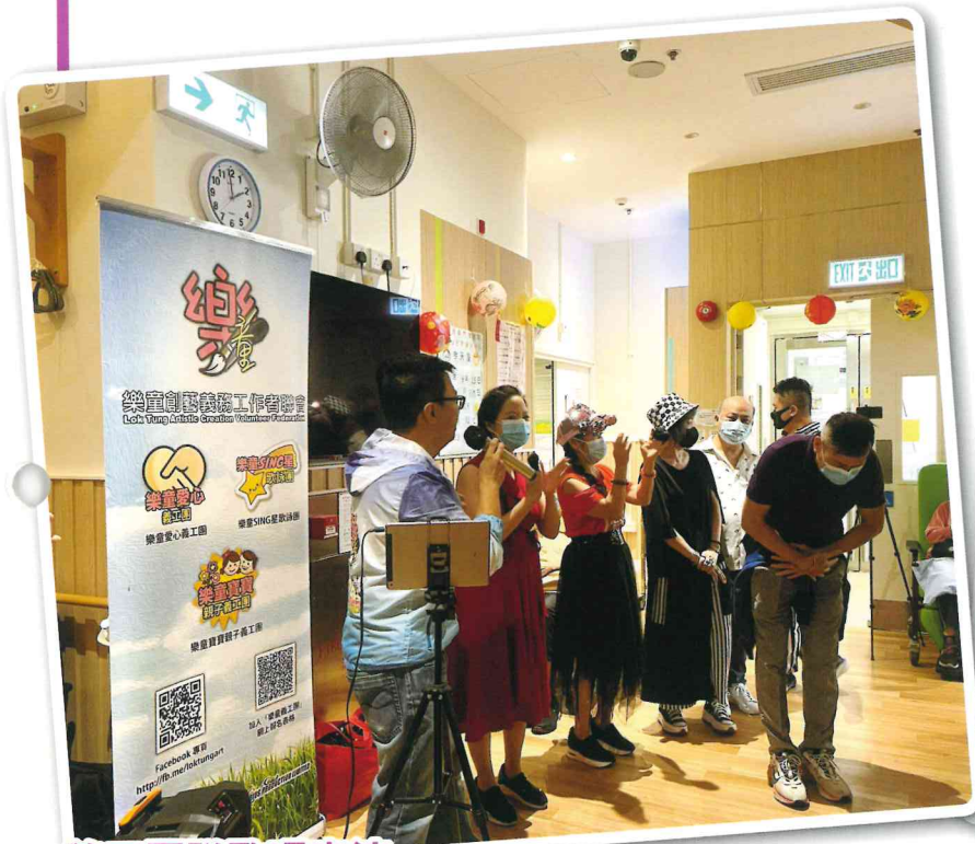
義工團隊歌唱表演

中秋節是一家團圓的日子，本院邀請童創意義工團隊到訪院舍舉辦中秋晚會，載歌載舞，吃月餅玩花燈，長者笑聲滿院。當日還邀請家人一同參與，與長者共度愉快的中秋晚上，樂聚天倫。