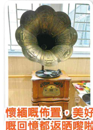
懷緬嘅佈置，美好嘅回憶都返晒嚟啦