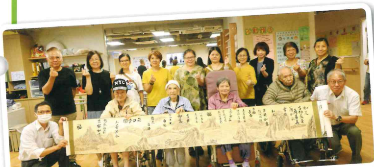
長者與導師、義工大合照

院舍舉辦了多次的書法活動並邀請書法老師教導院友基本的書法筆畫，藉此培養院友對書法的興趣。