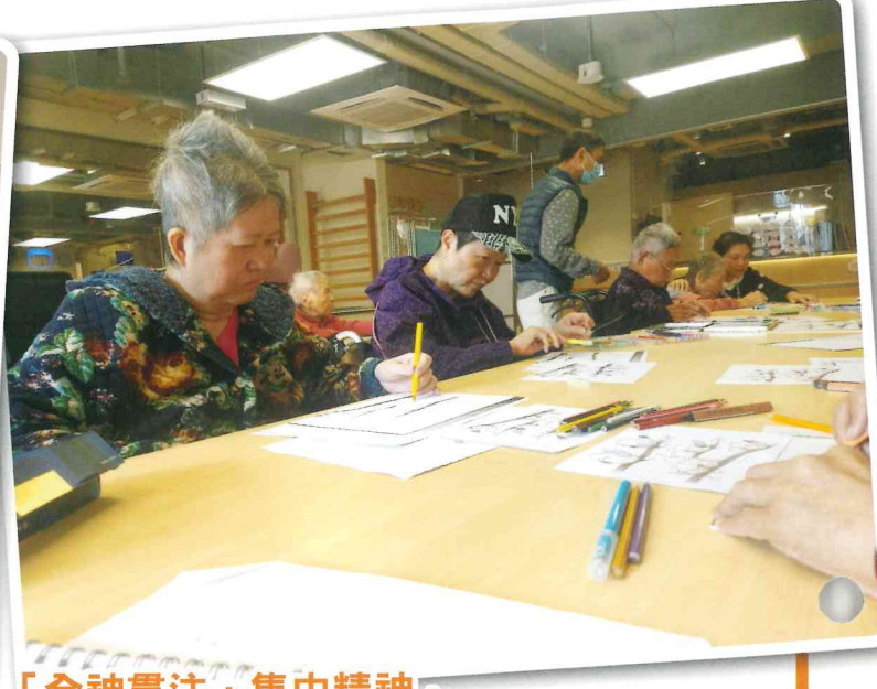
「全神貫注，集中精神」