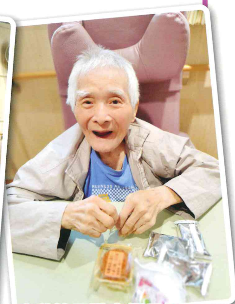
中秋節又點少得月餅