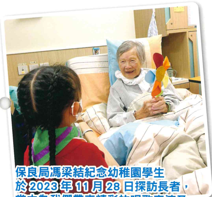
保良局馮梁結紀念幼稚園學生於2023年11月28日探訪長者，當中為我們帶來精彩的唱歌表演及親手贈送手工花朵。