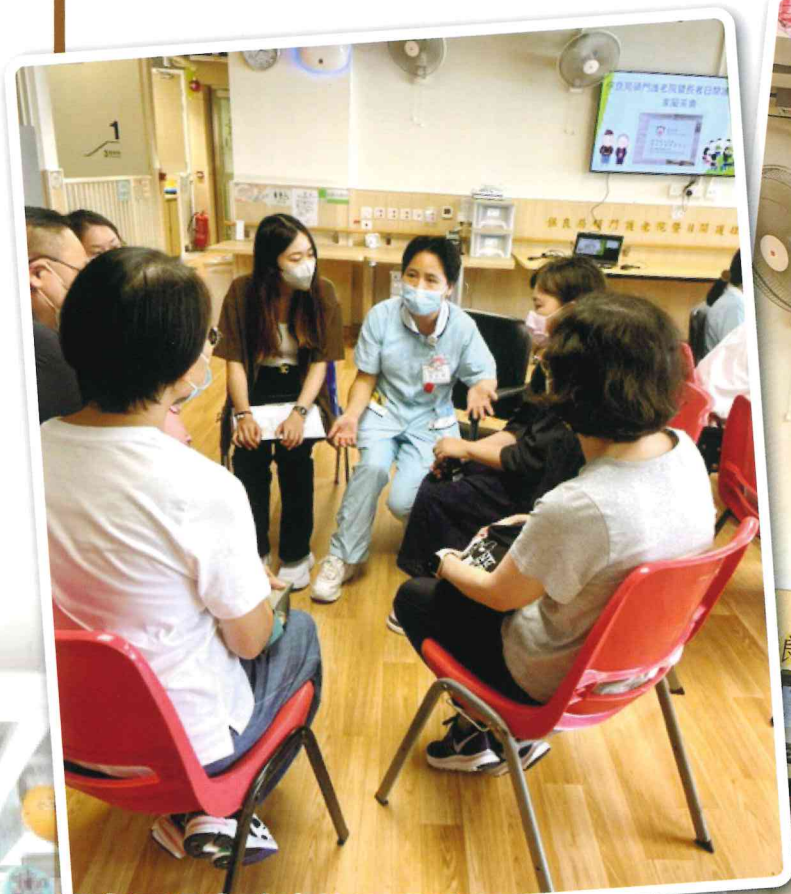
同事正分享院舍的照顧流程

本院期待與長者家人建立良好溝通及合作關係。故此，定期舉行「家屬茶會」活動，藉此介紹本單位的服務，並由家屬分享了他們對本院的服務期望。2023年9月23日舉行本院第一次的家屬茶會，當日家屬和同事們能坦誠的交流，可以提升提供服務時的質素。下次再舉行「家屬茶會」時，歡迎大家出席參與茶會。