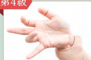
用力無法伸直手指