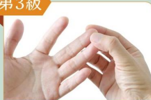
外力協助才能伸直