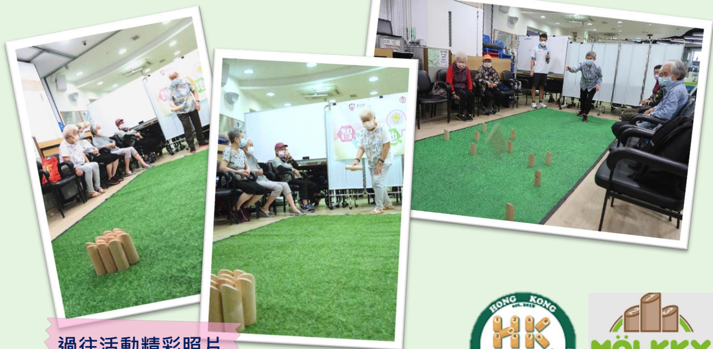
過往活動精彩照片

木柱運動可以訓練腦部思考及小肌肉，以及手眼協調等能力，加上沒有身形限制，而且可以訓練合群、互相幫助的精神，所以此新興運動是非常適合男女老幼同樂。各位有興趣測試自己的眼界嗎？歡迎報名參加 8/11 的芬蘭木柱體驗日！