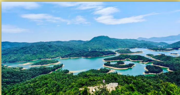
風景照：元朗大欖涌水塘