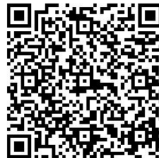
蘋果手機(IOS) QR Code