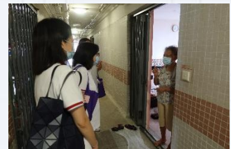
「中國銀行」 地區安老探訪