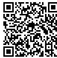
蘋果手機(IOS) QR Code