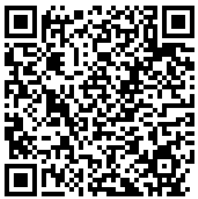
智能手機(Android) QR Code

有興趣既老友記可以用智能手機(Android)到 Google Play，而蘋果手機(IOS)到 App Store 下載應用程式