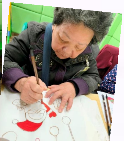
欣賞大家投入積極於畫畫的活動當中啊!