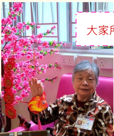
大家所做的鼠年掛飾做得好漂亮啊!讚~