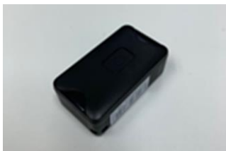
GPS 防走失裝置 (體積約 3 X 2 X 1 cm)