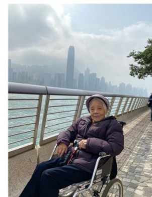
到達目的地空氣清新，心情放鬆，即刻影張大合照留念先。