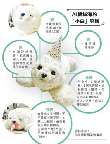
AI機械海豹「小白」解構

內容 | 與機械海豹互動及利用智能手機與海豹拍攝照片 日期 | 3月3日 (星期二) 時間 | 早上10:30 - 11:30 對象 | 服務券長者 名額 | 8名 地點 | 中心活動室