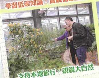
支持本地旅行，親親大自然