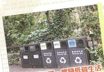
學習低碳知識，實踐低碳生活