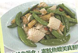
多食綠色蔬食，素魷魚媲美真鮮魷