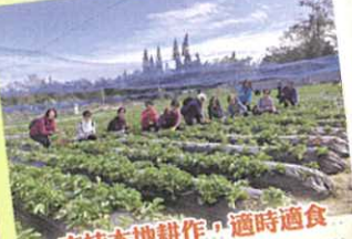
支持本地耕作，適時適食