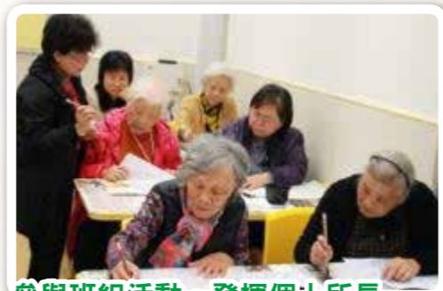
參與班組活動，發揮個人所長