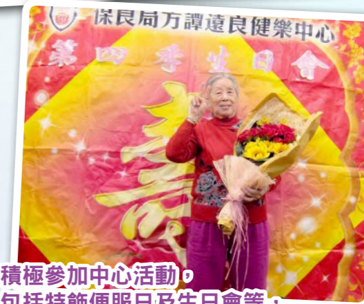
翠麗積極參加中心活動，當中包括特飾便服日及生日會等，不但擴闊翠麗的社交圈子，同時亦增加了對中心的歸屬感。