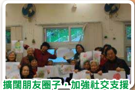
擴闊朋友圈子，加強社交支援