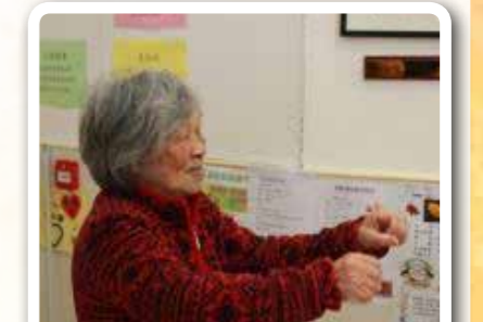
勤做健體運動，保持身體健康