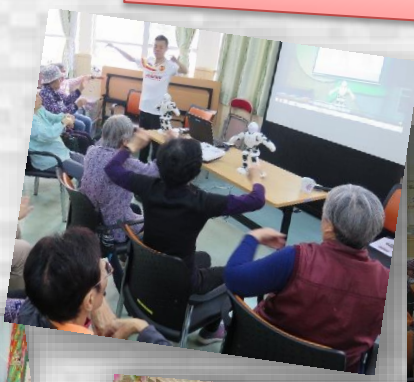
與機械人齊做運動