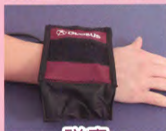
磁療 (magnetic therapy)