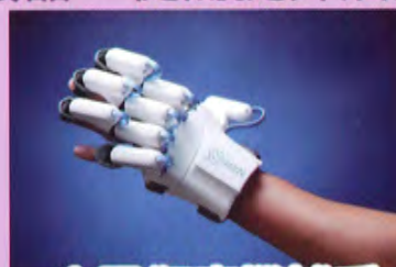
中風復康機械手 (Handy Rehab)