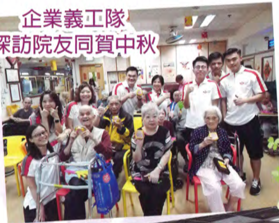
企業義工隊 探訪院友同賀中秋

我們亦連繫了不同社區團體及企業，組成義工隊在私營安老院舍舉行不同形式的探訪活動，例如布偶劇表演、中秋節製作冰皮月餅、集體遊戲、獻唱經典金曲等等，為院友帶來一個熱鬧和愉快的探訪，義工不分老中青，他們均表示在節日探訪私院院友倍添意義！