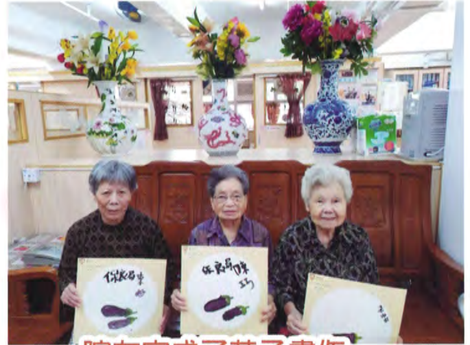
院友完成了茄子畫作

我們亦連繫了不同社區團體及企業，組成義工隊在私營安老院舍舉行不同形式的探訪活動，例如布偶劇表演、中秋節製作冰皮月餅、集體遊戲、獻唱經典金曲等等，為院友帶來一個熱鬧和愉快的探訪，義工不分老中青，他們均表示在節日探訪私院院友倍添意義！