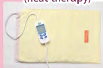
熱療 (heat therapy)