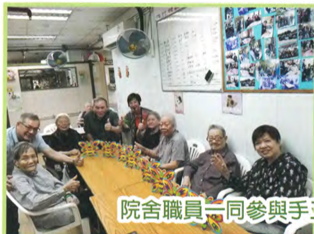
院舍職員一同參與手工班