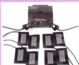
單色紅外線多功能治療儀 (Anodyne)