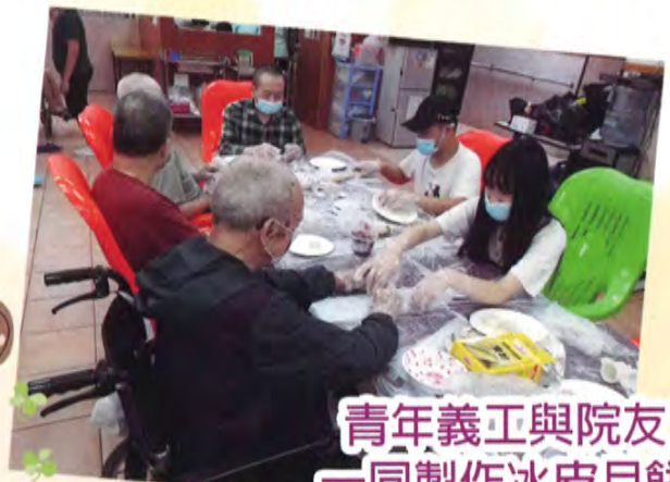
青年義工與院友 一同製作冰皮月餅