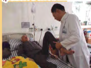
被動運動 (passive mobilization)