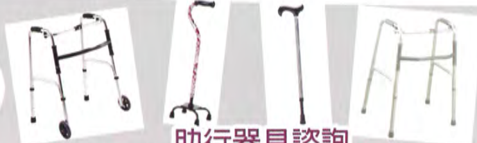
助行器具諮詢 (Walking Aids consultation)