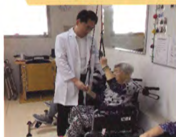
關節活動運動 (joint mobilization)