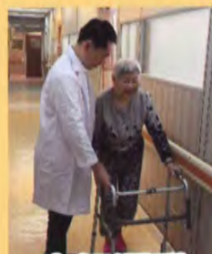
步行運動 (Gait training)