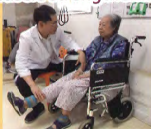
肌肉運動 (muscle strengthening)