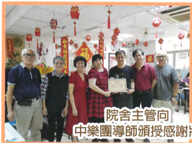
院舍主管向 中樂團導師頒授感謝狀

我們與荃灣及葵青區60多間私營安老院及合約/自負盈虧院舍合作，共同為院友提供專業服務。感謝院舍對我們的信任，在半年期間院舍的轉介個案逐步上升；大部分院舍亦歡迎小組及活動，甚至有院舍職員或主管落場參與及支持，與眾同樂！