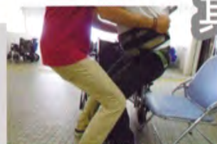
職員/照顧者培訓 (Staff/Carer training)