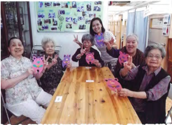
院友在銀齡導師的指導下完成豬仔掛飾

社工在私營安老院舍進行藝術小組，包括：手工、畫畫及音樂三大範疇，由銀齡導師及區內人士組成藝術團隊到私營安老院舍任教，以提升院友成功感及社交機會。另外我們更邀請了非洲鼓及中樂隊導師為院友帶來特別表演，以音樂會友！