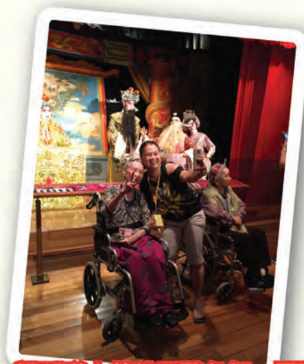
潔清一講到睇大戲就眉飛色舞，展露笑容。