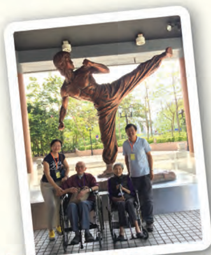
鍾鵬和淑文與家人到李小龍像前面留影