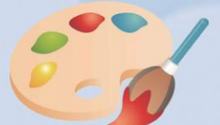
創藝同行-畫出彩虹