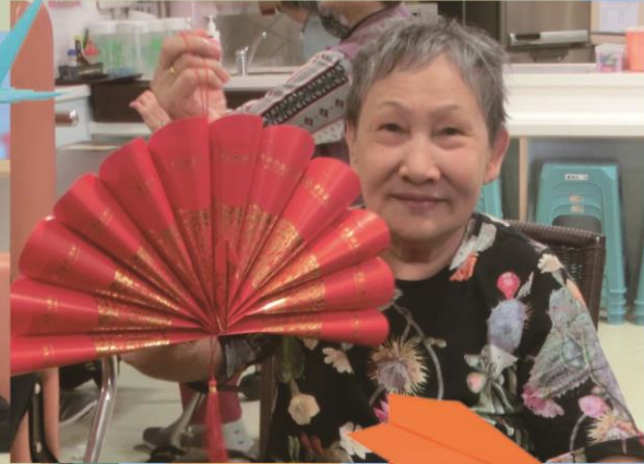
創藝同行-工紙哥兒