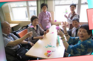
母親節活動「愛滿頌親恩」