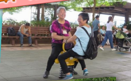
春季戶外健步旅行日