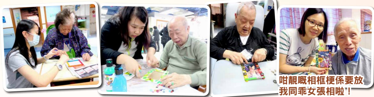
咁靚嘅相框梗係要放我同乖女張相啦！

2016年11月20日，是一年一度的長者日。老友記為自己的家庭以及社會建設作出了重大貢獻，值得我們敬重。除了平時對老友記的尊重外，我們還與老友記一同用鈕扣制作心意相架，盛載暖暖愛意，讓老友記能夠紀念溫馨的一瞬間，細細回味人生溫熱的味道。