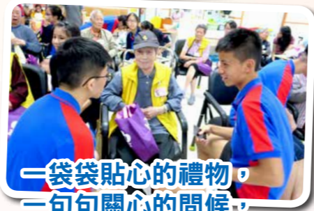
一袋袋貼心的禮物， 一句句關心的問候， 給我們整個冬天都感 受到歡樂與溫暖。