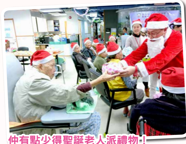
仲有點少得聖誕老人派禮物！