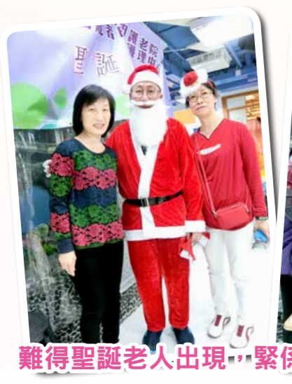
難得聖誕老人出現，緊係要一齊合照番張啦！