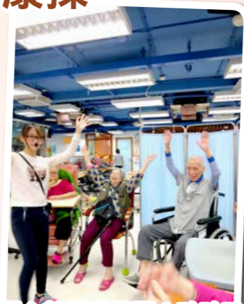
開心就係咁簡單！哈哈！