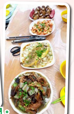
好好味呀，辛苦廚師們了，謝謝你們。