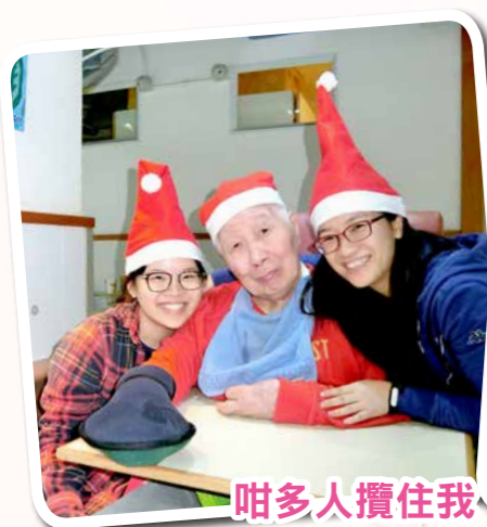
咁多人攞住我，一定暖啦！！