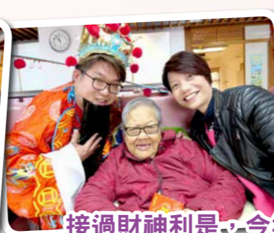
接過財神利是，今年時時笑開眉