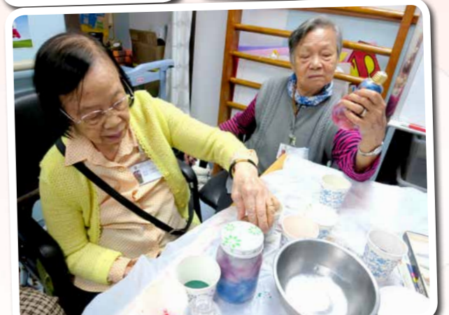
有我哋嘅作品幫院舍佈置，今個冬天實暖笠笠！