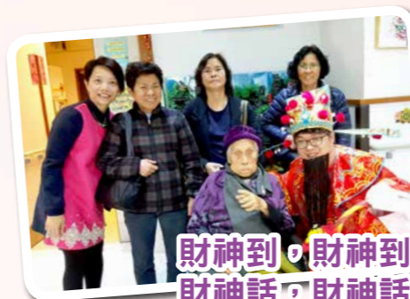
財神到，財神到，好心得好報！ 財神話，財神話，今年會進步！ 接過財神利是，今年健康好福氣！

除咗有屋企人同我地過年外，仲有財神爺來院舍派利是，真係溫馨又熱鬧！睇我地燦爛的笑容，定能融化冬日的冷雪，為院舍帶來一片暖陽。