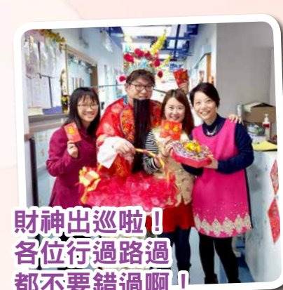
財神出巡啦！ 各位行過路過 都不要錯過啊！