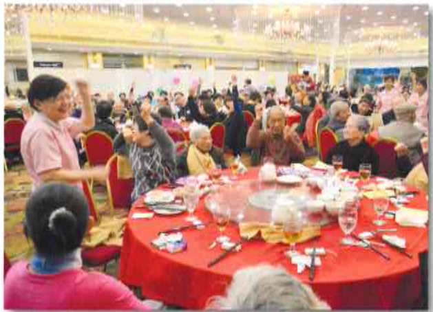
桂姐帶領院友參與活動，樂在其中

桂姐獲選 2017 年南華早報護理精神大獎，正是對她多年來用心照料長者致以崇高的敬意。