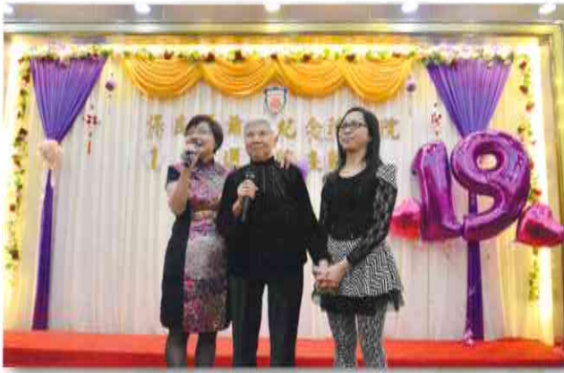
桂姐與院友、同工為院慶表演粵曲