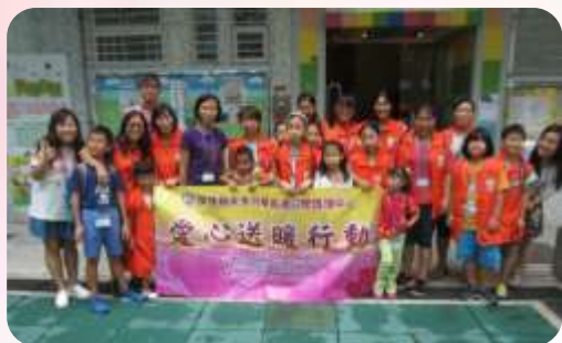
香港基督教服務處 深東樂TEEN會