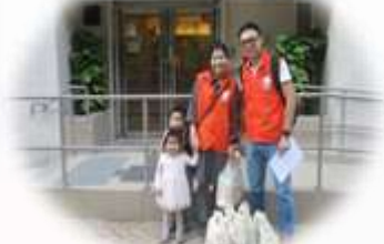
亞科視訊系統工程 有限公司