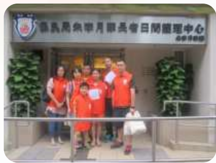
亞科視訊系統工程 有限公司