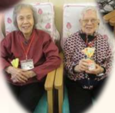
忍不住了，要咬一口