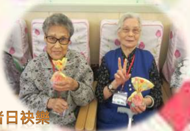
好開心，長者日快樂