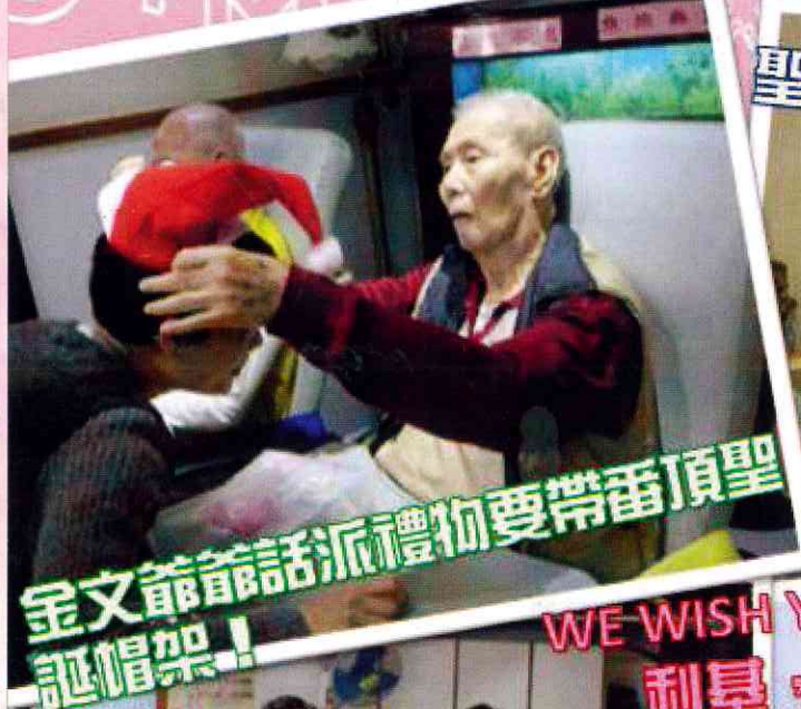
金文爺爺話派禮物要帶番頂聖誕帽架！