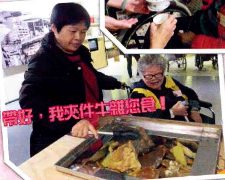
帶好，我夾件牛雜您食！