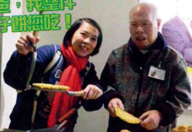
爸爸，我整件 格仔餅您吃！