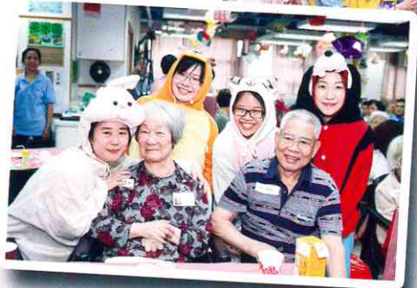
嘍嘍嘍！呢四隻動物走出黎做咩啊？