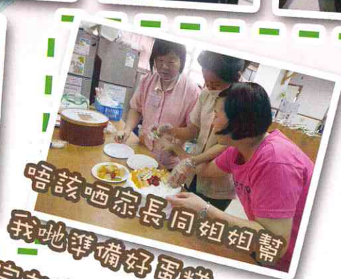
唔該晒家長同姐姐幫 我哋準備好蛋糕，玩 完就有得食!