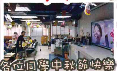
各位同學中秋節快樂