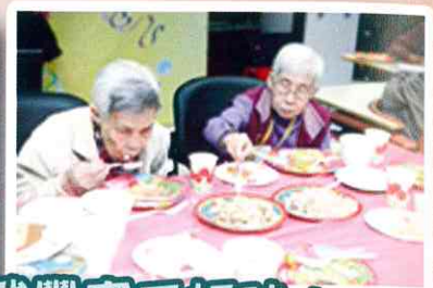
今年食物果然豐富又好味！