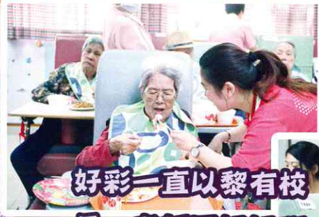
好彩一直以黎有校長、老師同姐姐嘅照顧，我哋先可以咁精靈活潑！