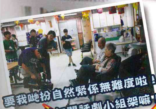
要我哋扮自然緊係無難度啦! 我哋平時參加開話劇小組架嘛!