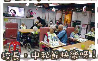
校長，中秋節快樂呀!