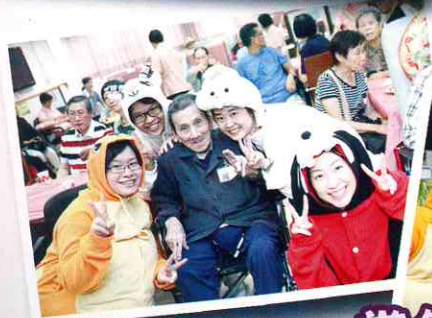
當然唔少得同大家一齊影相啦！