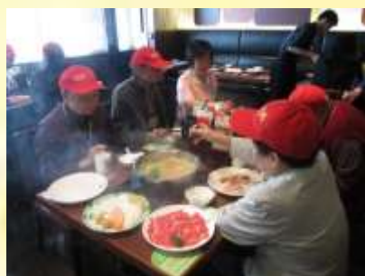
築福香港--飲食派對