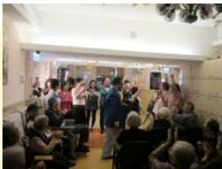
敬老金曲會知音 (金詠潮歌班同學會)