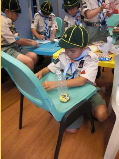
小義工全情投入設計環保樂器！

活動邀請小學生義工，從探訪院舍及社區長者中，學懂敬愛長者，達致「愛相傳」之目標。