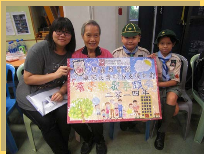
義工們到院舍探訪長者，並與一眾長者共唱《喝采》，互相打氣。