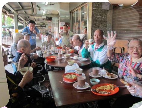
耆義同行-外出享用下午茶