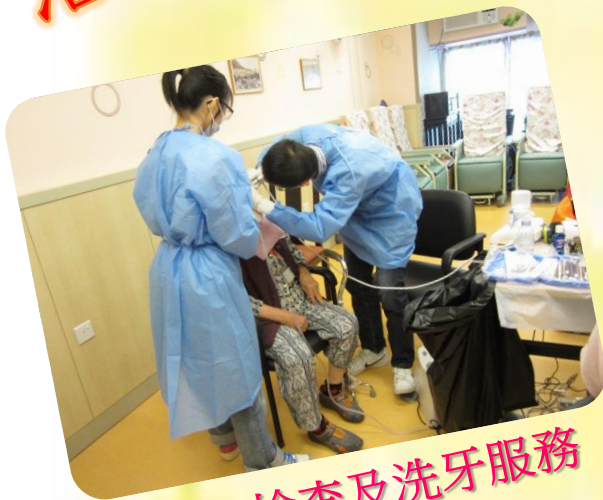
口腔檢查及洗牙服務