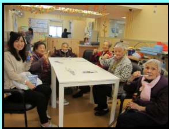
教育小組之日常生活