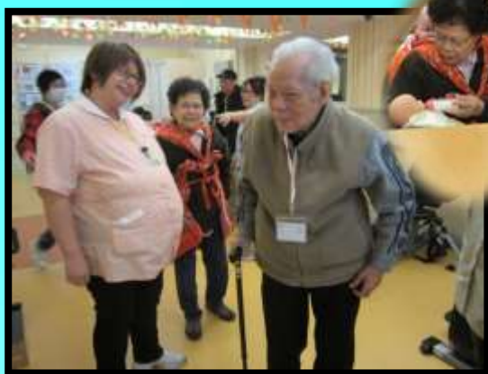
懷舊小組之生兒養女