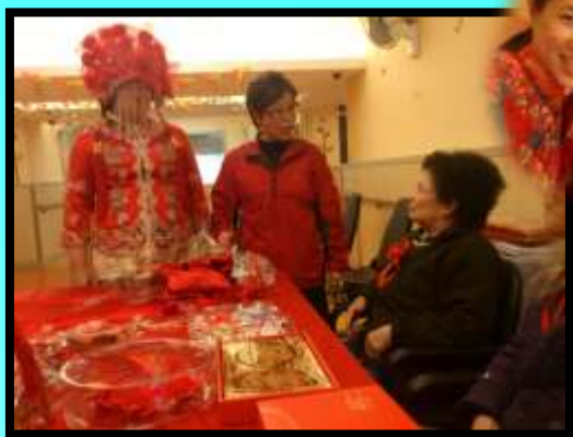
懷舊小組之談婚論嫁