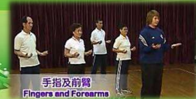
手指及前臂 Fingers and Forearms

宜：天氣寒冷時，如要外出，要穿著合適保暖禦寒的衣物，並避免長時間置身於寒冷的環境或寒風中。