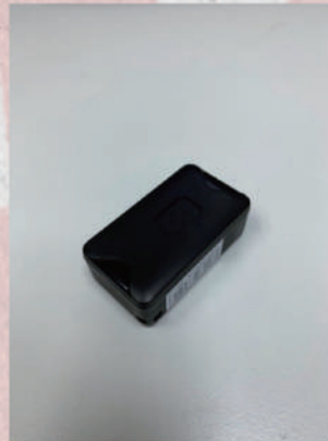
GPS 防走失裝置 (體積約 3 X 2 X 1 cm)