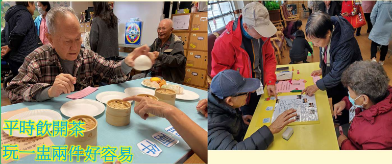
平時飲開茶 玩一盅兩件好容易

油尖旺家居隊的服務使用者及維港灣長者會所義工 一同製作攤位遊戲供區內人士试玩。今次到訪周老 ，長者都好雀躍，積極玩攤位遊戲， 玩完仲有禮物收，渡過一個快樂星期六。