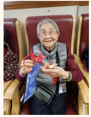
大角咀天主教小學同學們於2/1/20到中心探訪