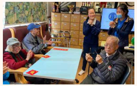
嘉諾撒聖瑪莉學校同學們於 21/1/20 到訪中心。