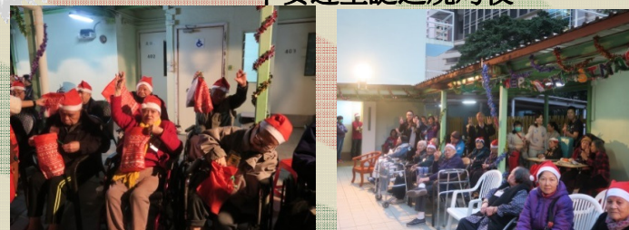
平安迎聖誕之燒烤夜