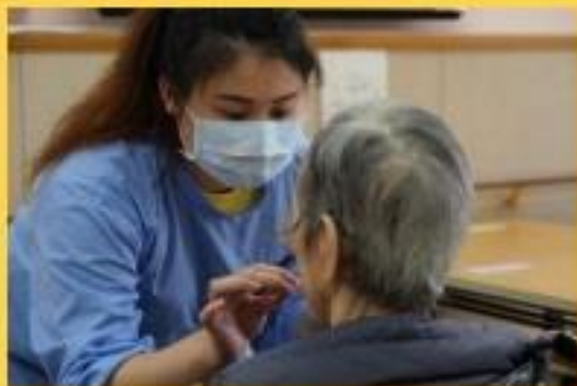
生命快門活動職員為長者扮靚靚