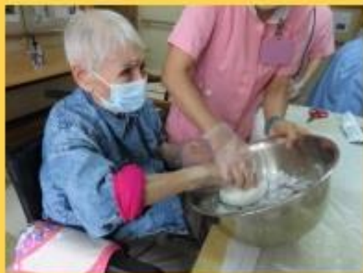
長者與職員一起製作冰皮月餅