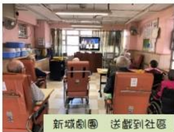
新城劇團 送戲到社區